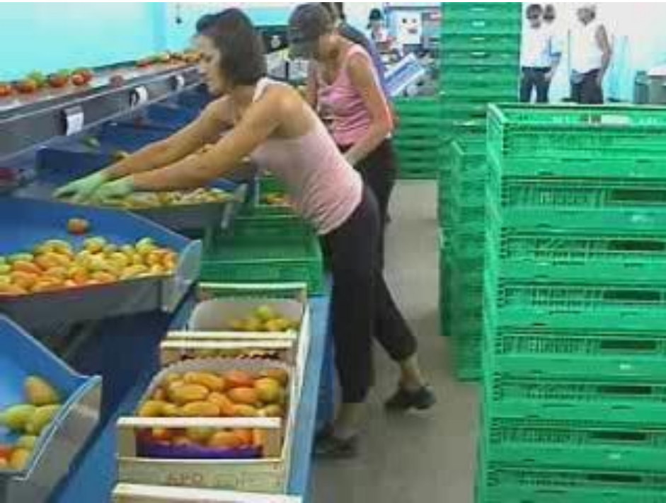
Check-list OCRA Punteggio finale ponderato per durata netta