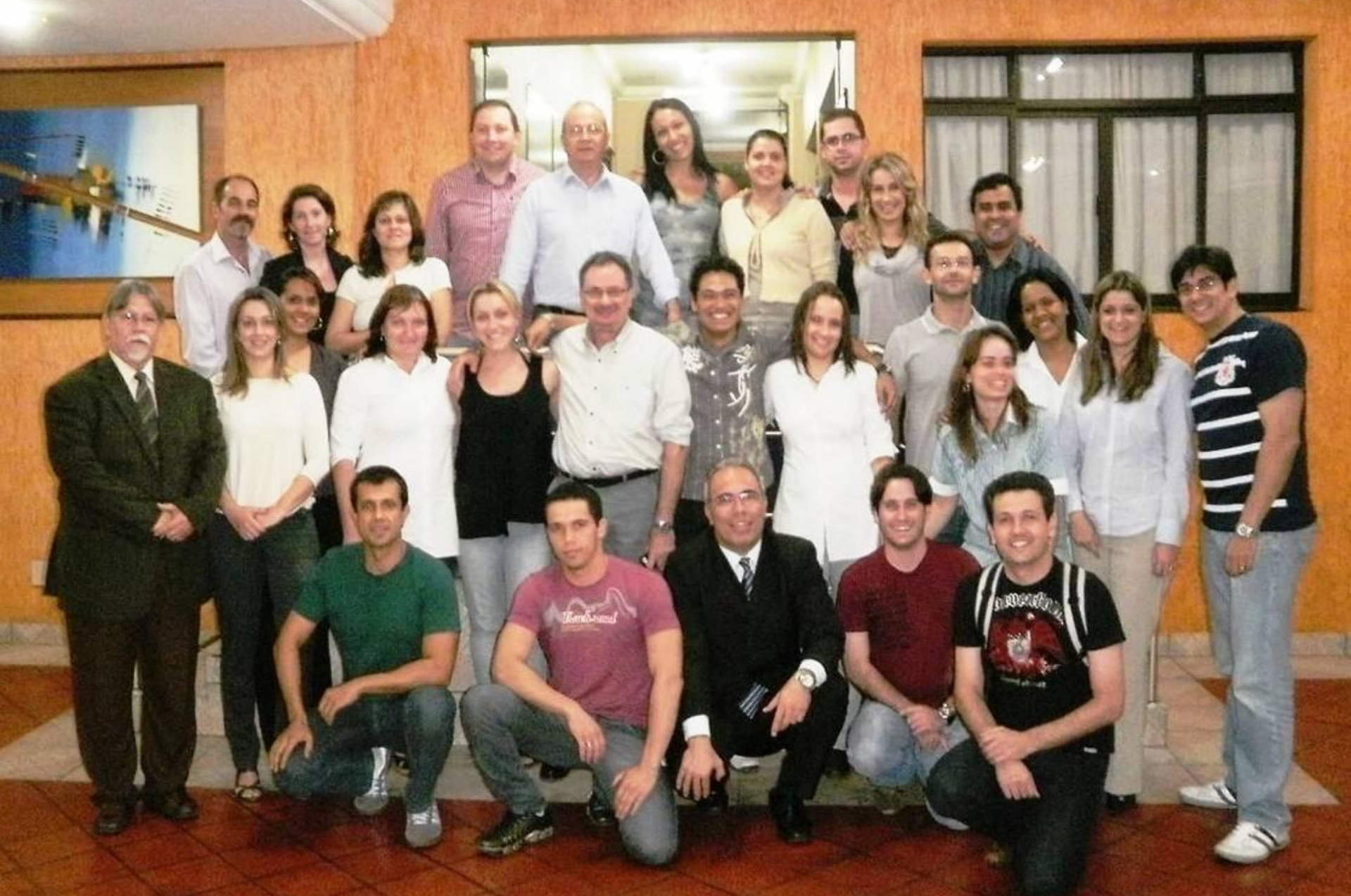
11º CURSO TÉCNICO OCRA / RIO VERDE – GO - 2010 (in company)