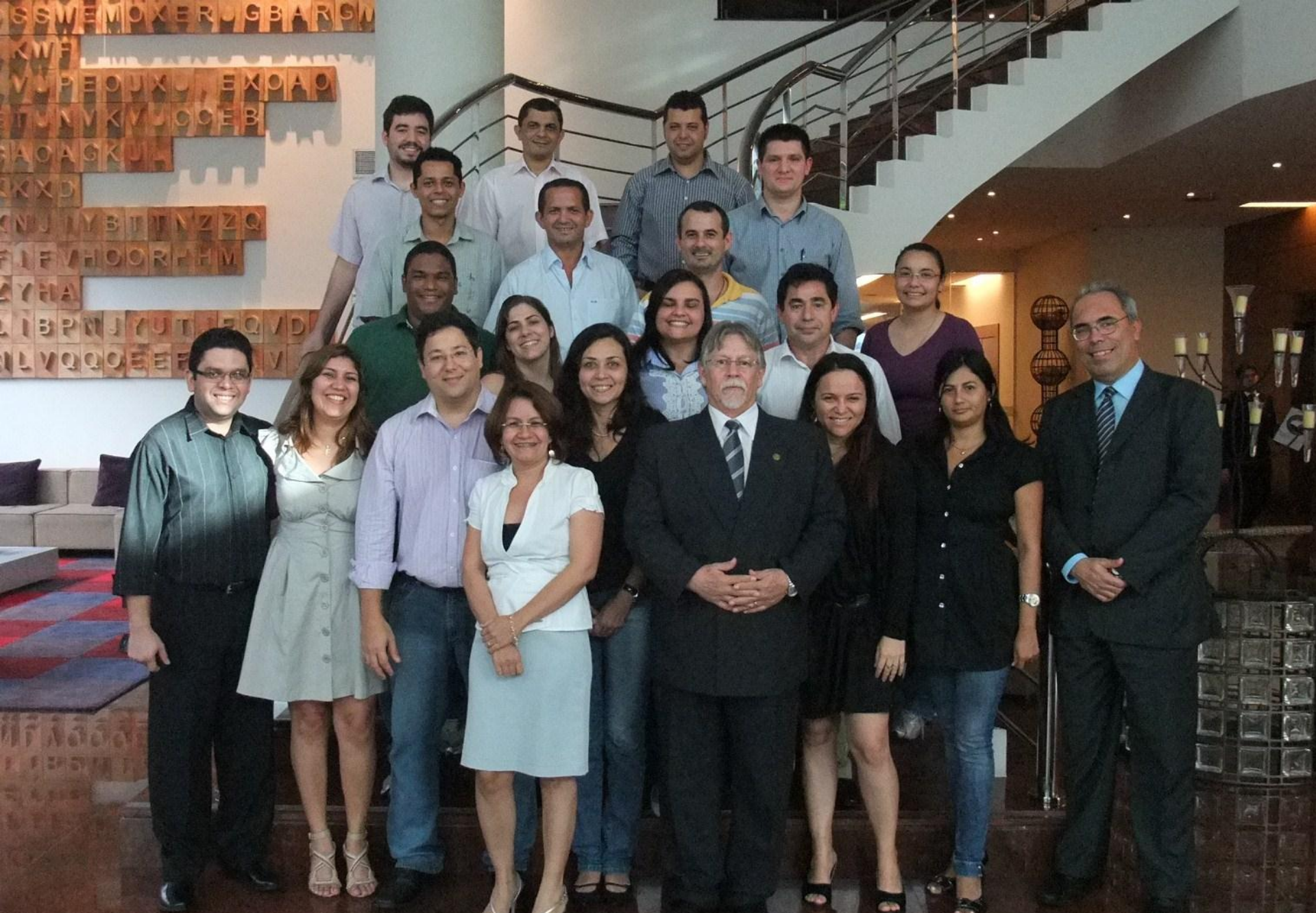
18º CURSO TÉCNICO OCRA - MANAUS 2011 (in company)