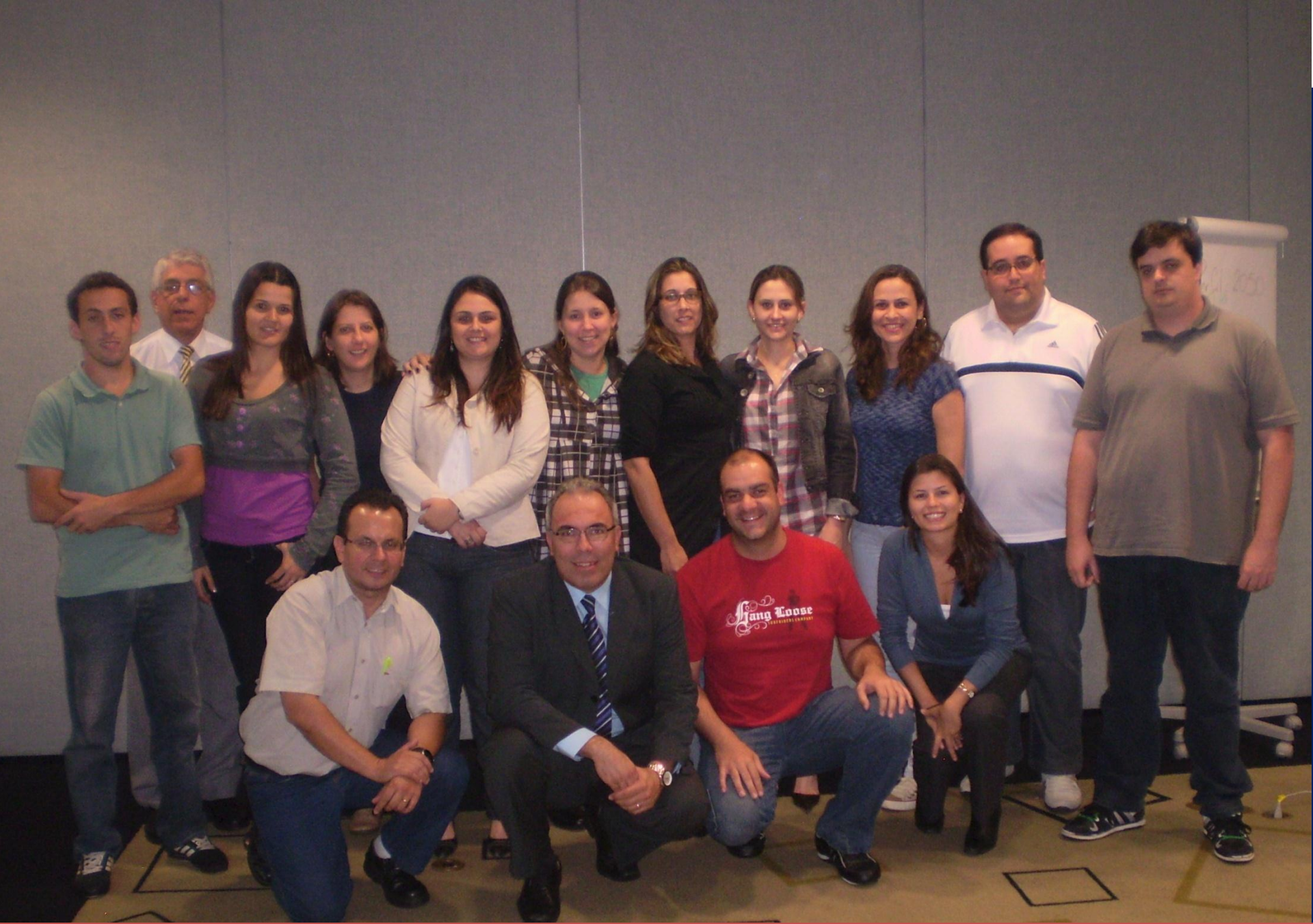
17º CURSO TÉCNICO OCRA - SÃO PAULO 2011