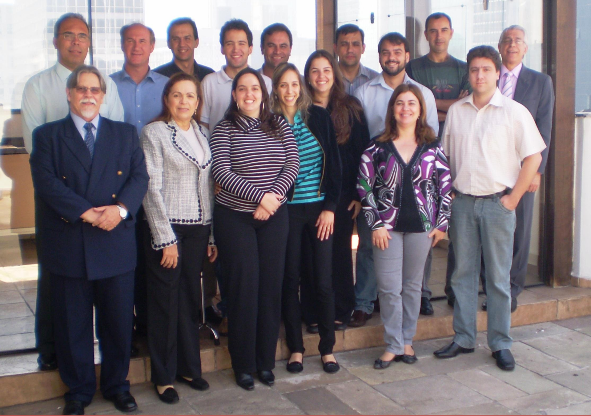
13º CURSO TÉCNICO OCRA - SÃO PAULO 2010