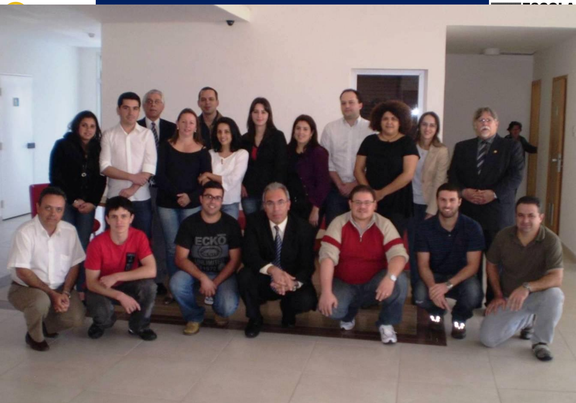
12º. CURSO TÉCNICO OCRA / SÃO JOSÉ DOS CAMPOS – 2010