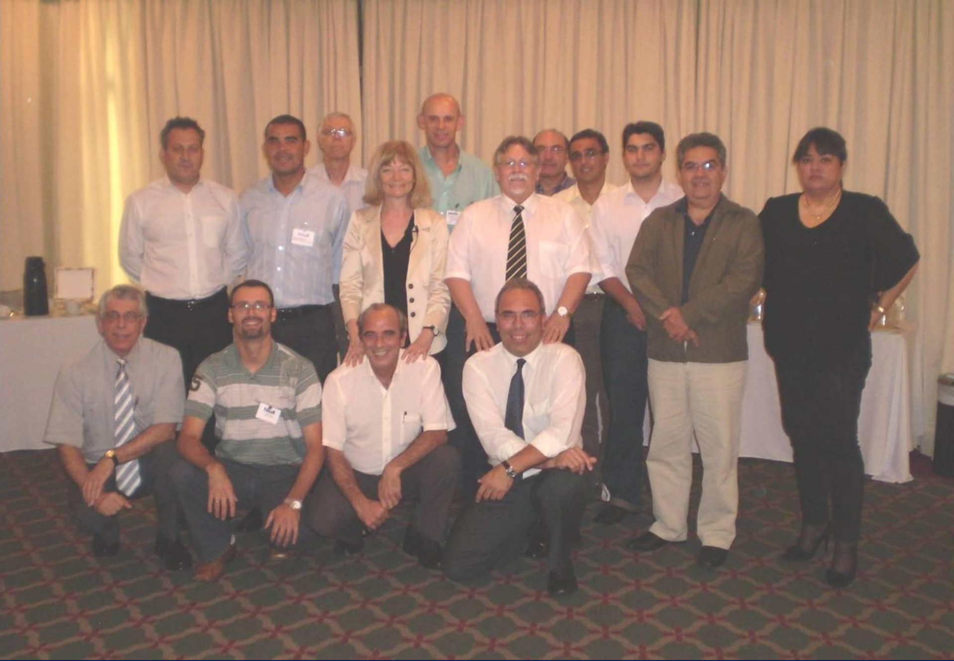
2º CURSO TÉCNICO OCRA – SÃO PAULO - 2009