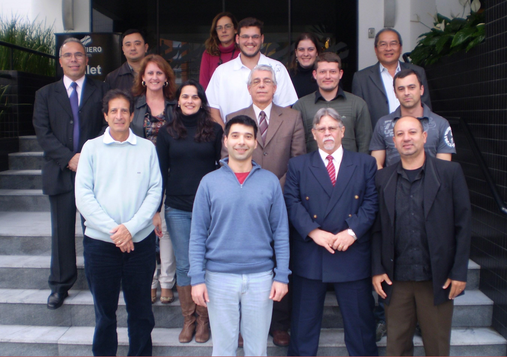
14º CURSO TÉCNICO OCRA – CURITIBA 2010