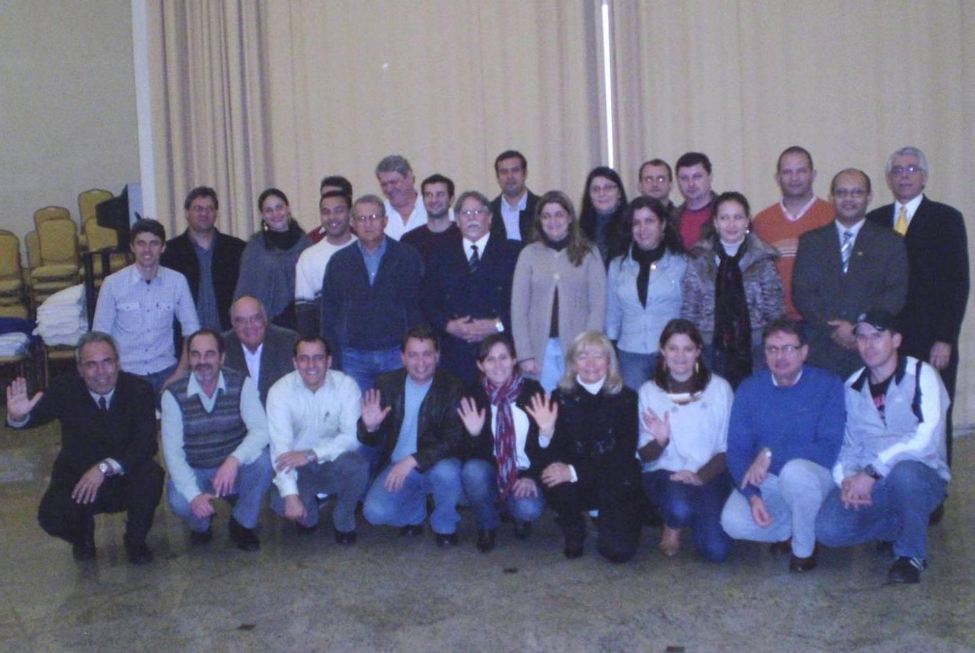
7º CURSO TÉCNICO OCRA – BENTO GONÇALVES – 2009 (in company)