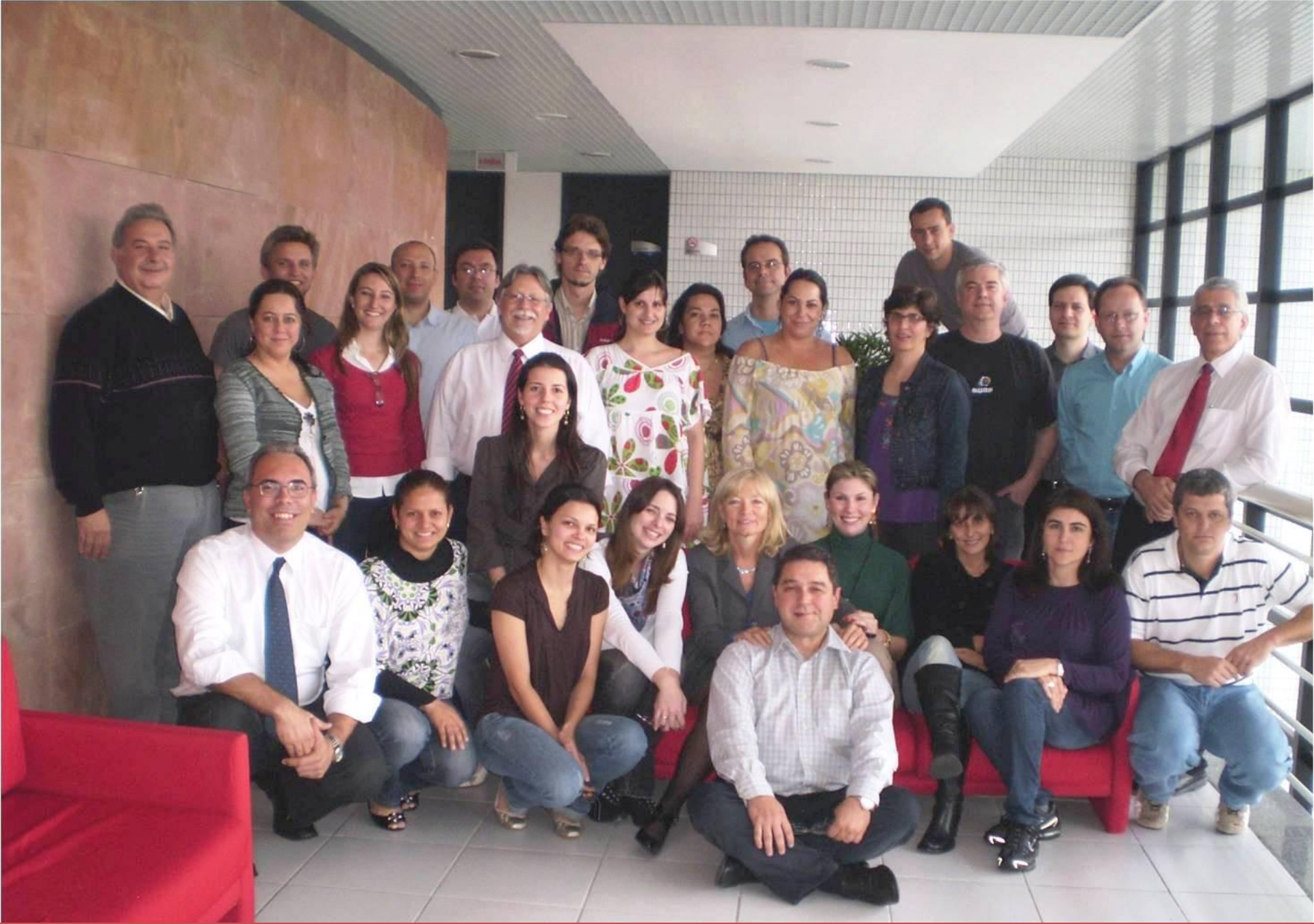
5º. CURSO TÉCNICO OCRA - CURITIBA - 2009