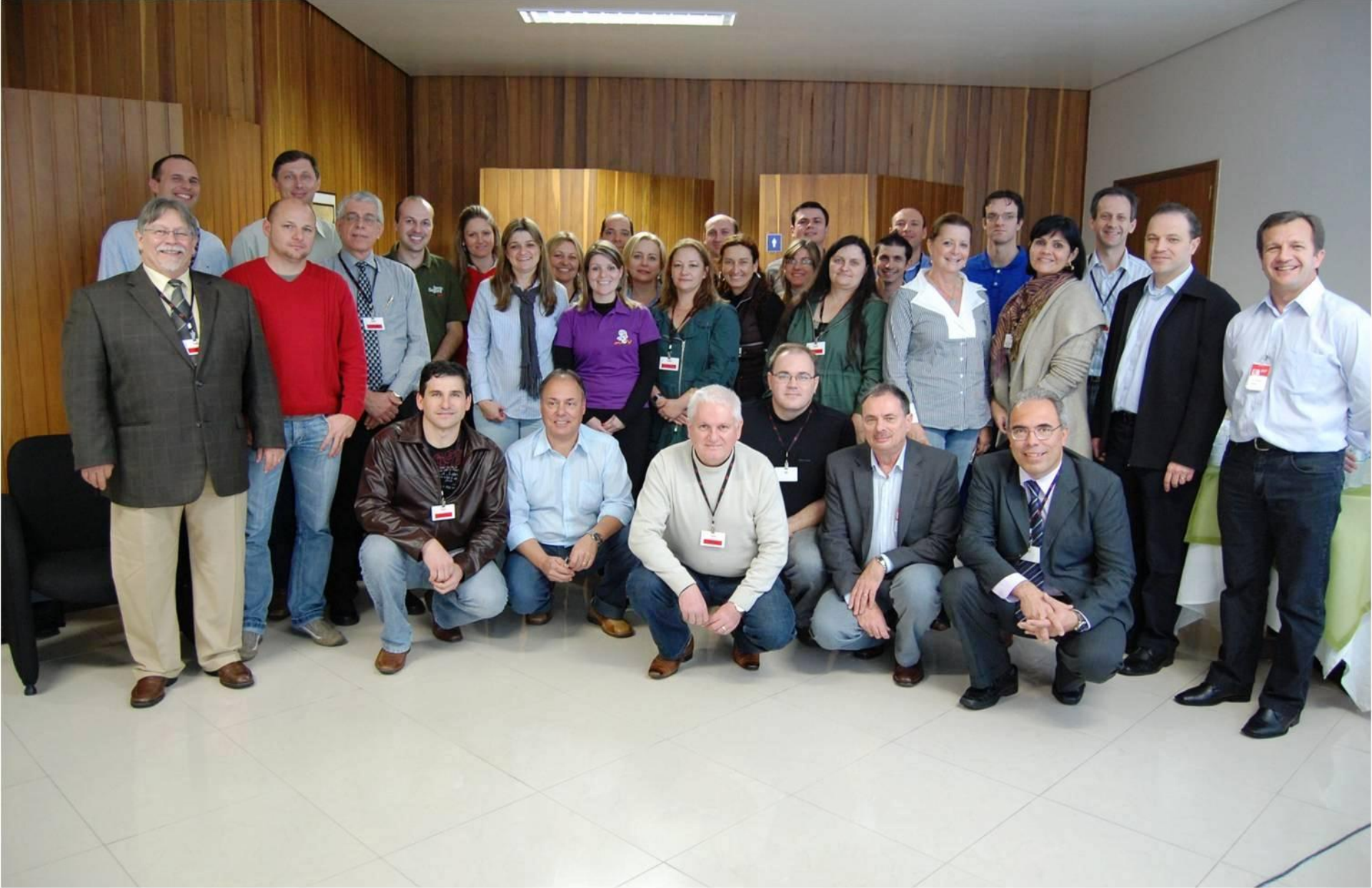
10º CURSO TÉCNICO OCRA – CONCÓRDIA - 2010 (in company)